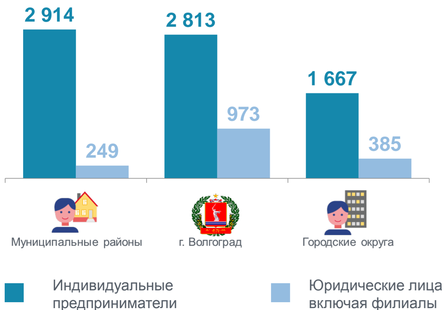
Распределение по муниципальным образованиям, единиц